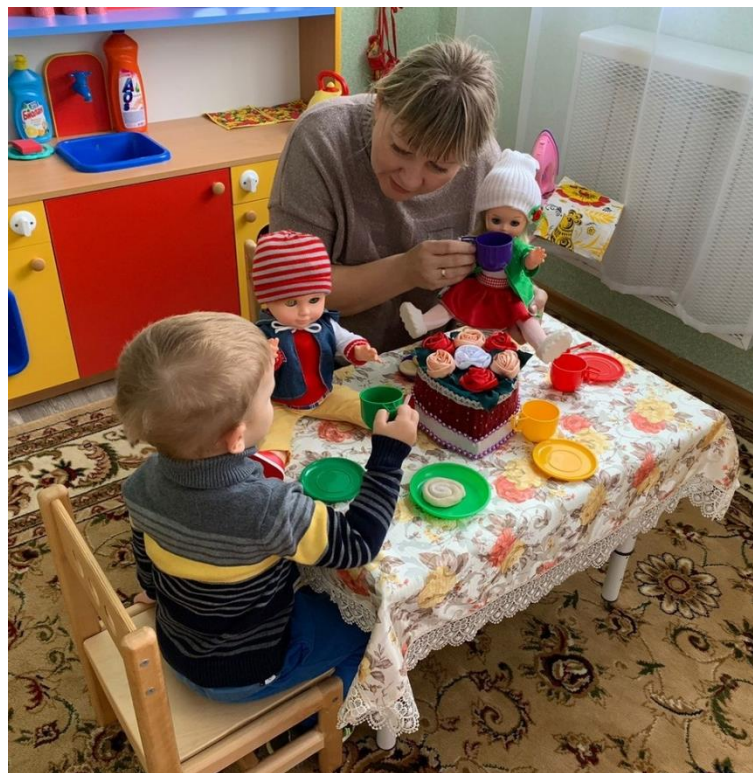
Формирование предпосылок сюжетной игры