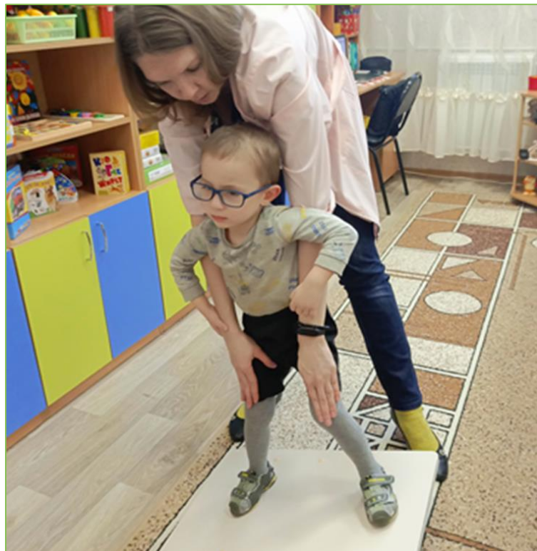
Развитие кинестетического чувства