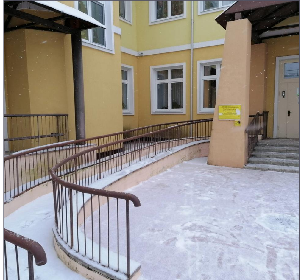
Пандусы и съезды