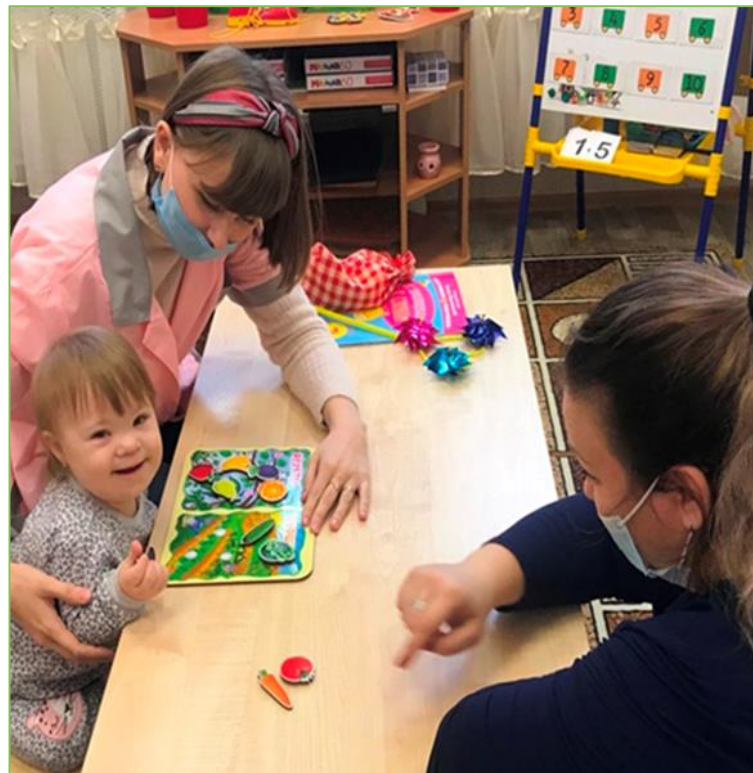
Развитие внимания и мелкой моторики