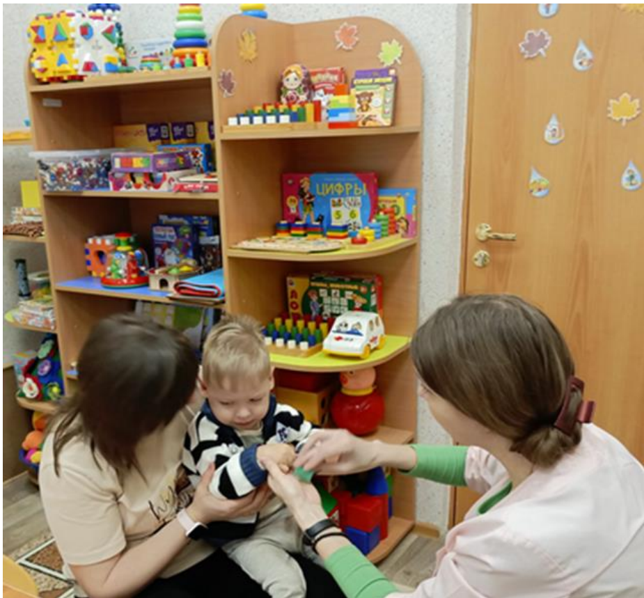
Участие родителей на занятиях