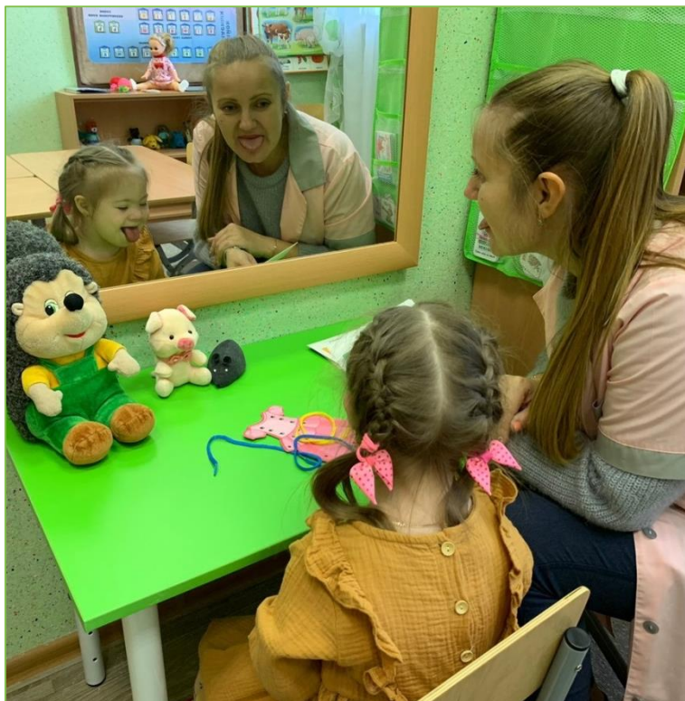
Развитие артикуляционной моторики и пальцевого праксиса