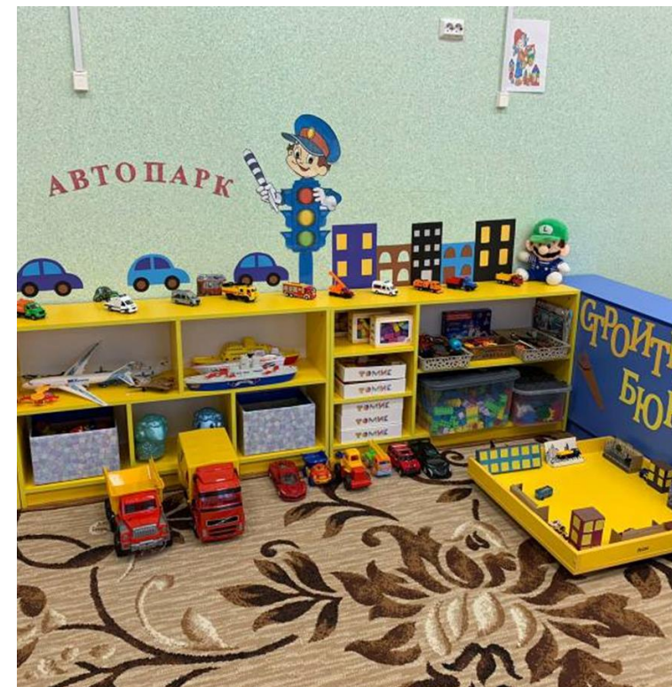
Развивающая предметно-пространственная среда игровой комнаты педагога-психолога