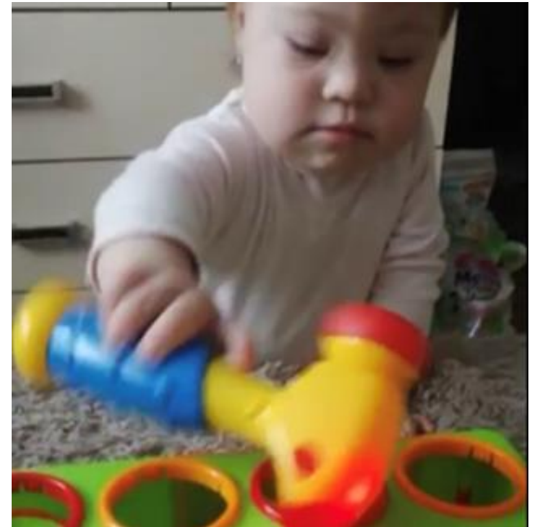
Фото- и видеоотчеты от родителей о выполнении рекомендаций специалистов