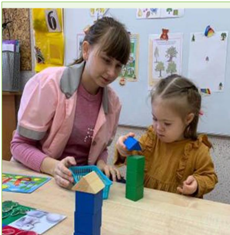
Организация предметной деятельности