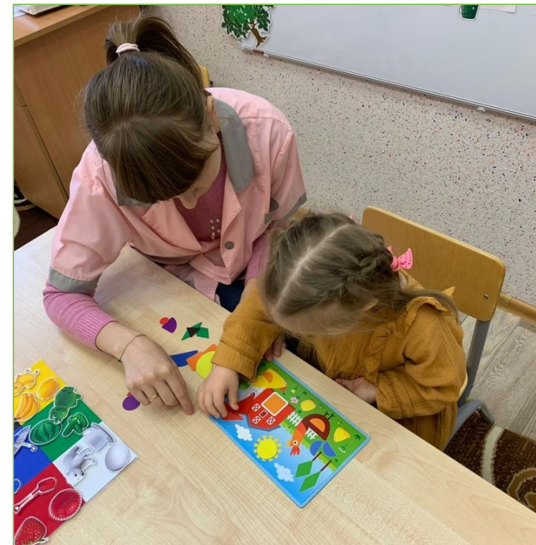
Развитие пространственного восприятия