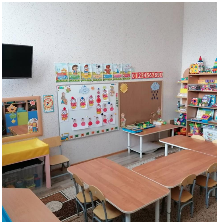
Развивающая предметно-пространственная среда кабинета учителя-дефектолога