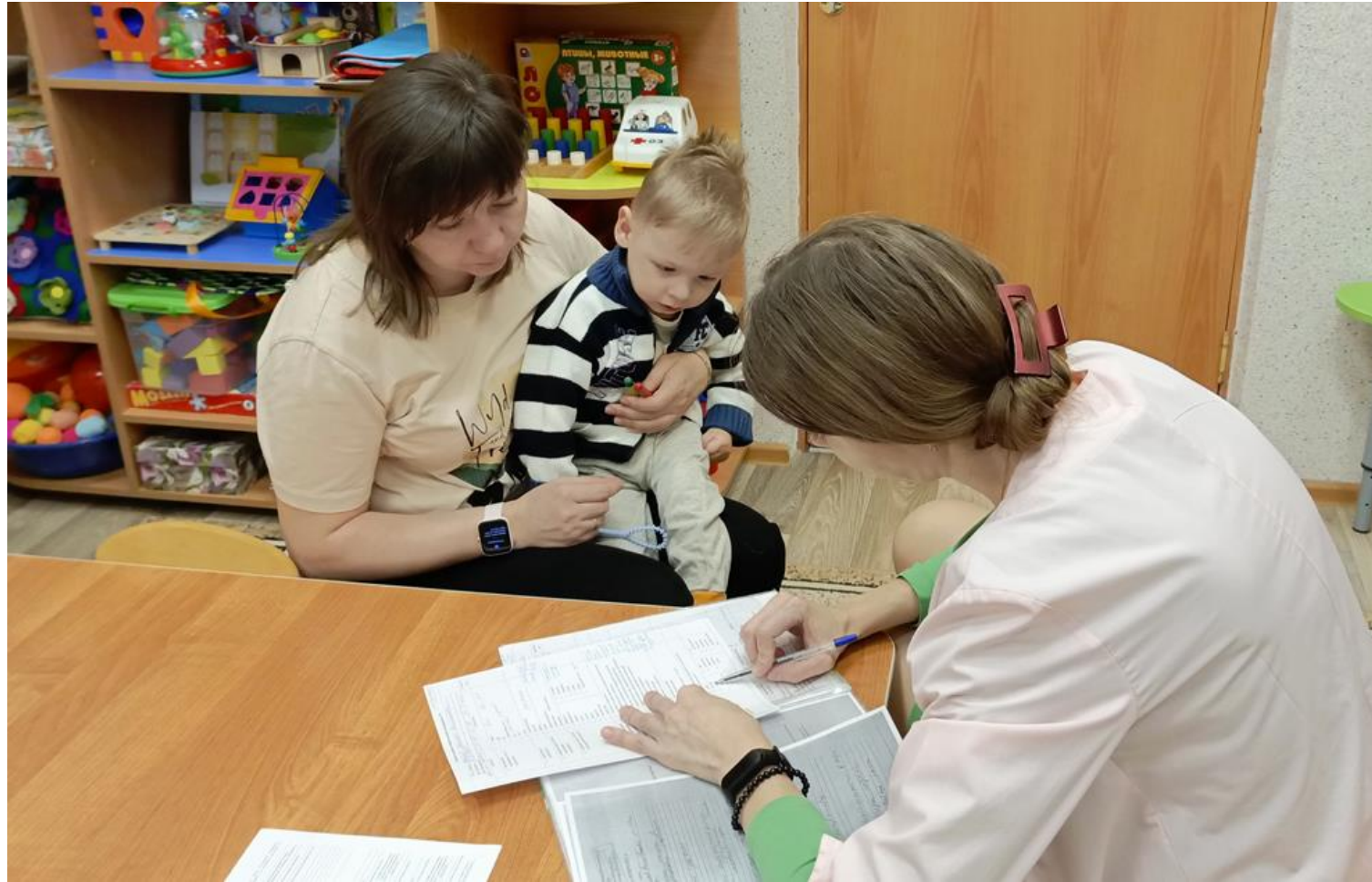
Анализ медицинской документации