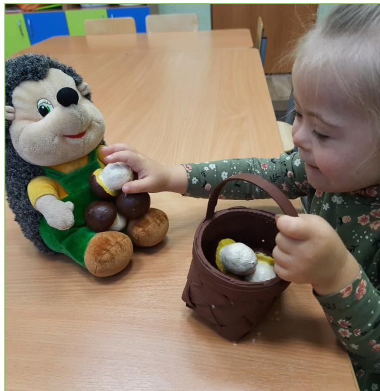
Формирование способов коммуникации