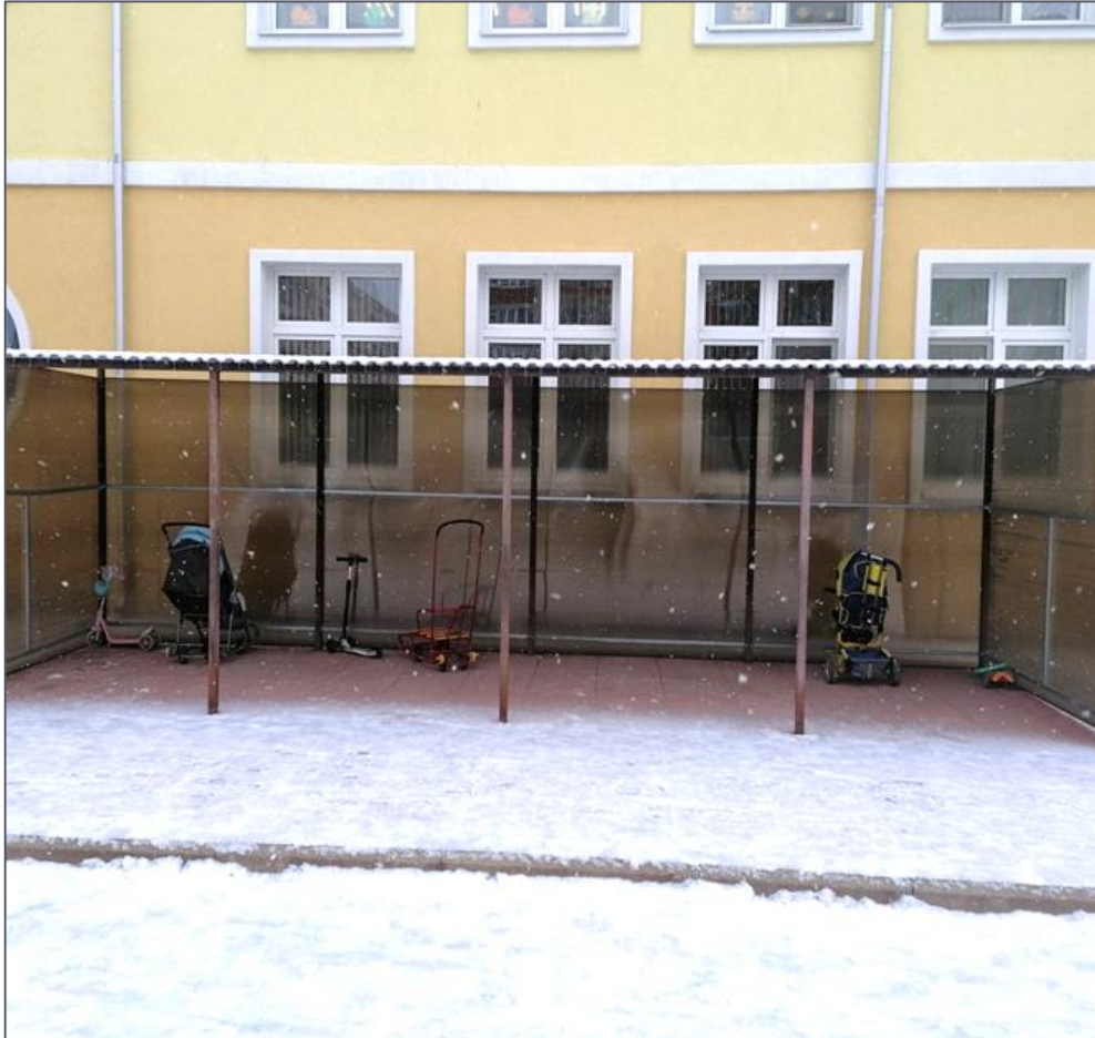
Навесы для колясок