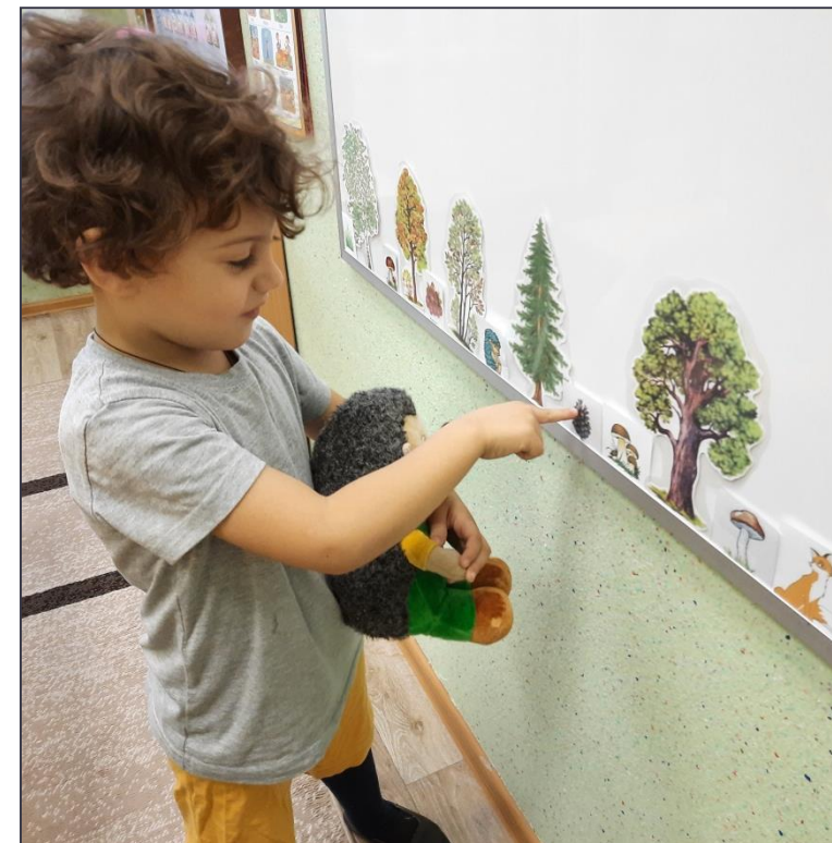
Формирование пассивного словаря